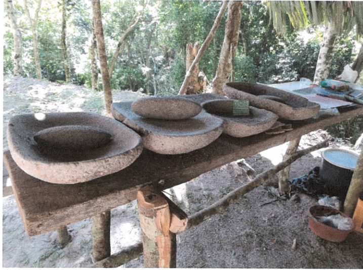
Esquina SW – A-10