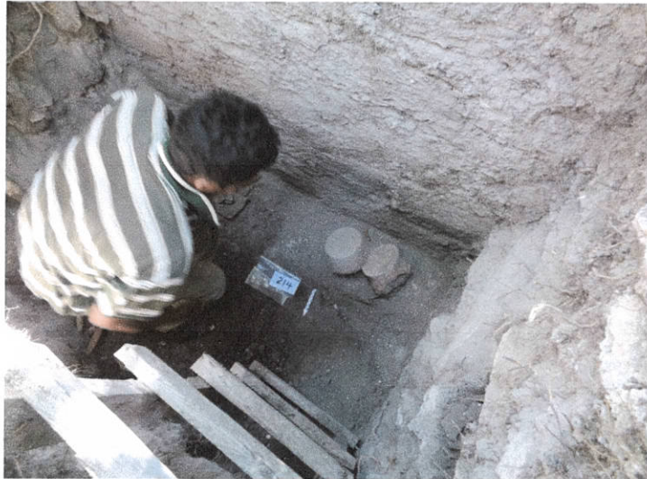
Entierro # 1 – A-4